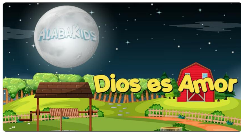
Dios Es Amor - Alaba Kids

https://www.youtube.com/watch?v=cKHOYcKnHHM