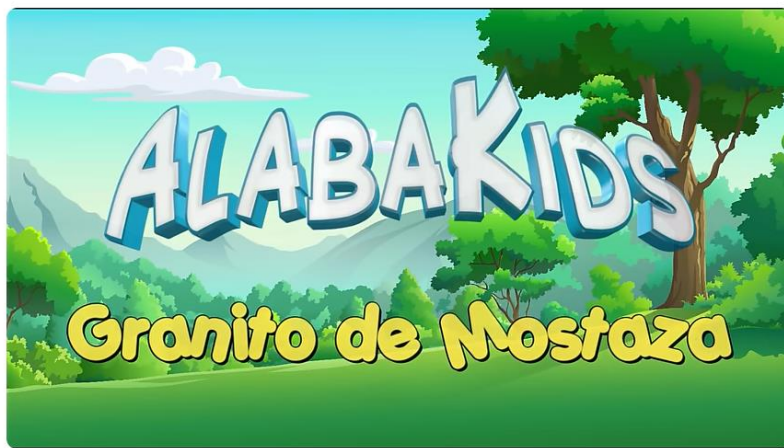
Granito De Mostaza - Alaba Kids

https://www.youtube.com/watch?v=8VtnGUXgvtk