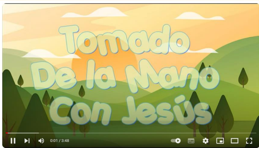
Tomado De La Mano Con Jesús - Alaba Kids

https://www.youtube.com/watch?v=q_qsB5E8kYw