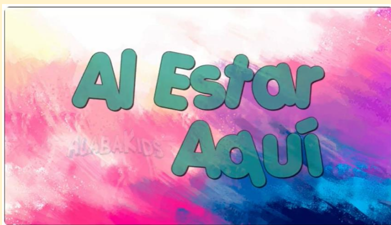
Al Estar Aquí - Alaba Kids

https://www.youtube.com/watch?v=UleNI8D2GxM&l