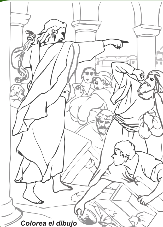
Colorea el dibujo

¿Qué actitud tendrías al encontrar lo que Jesús encontró?